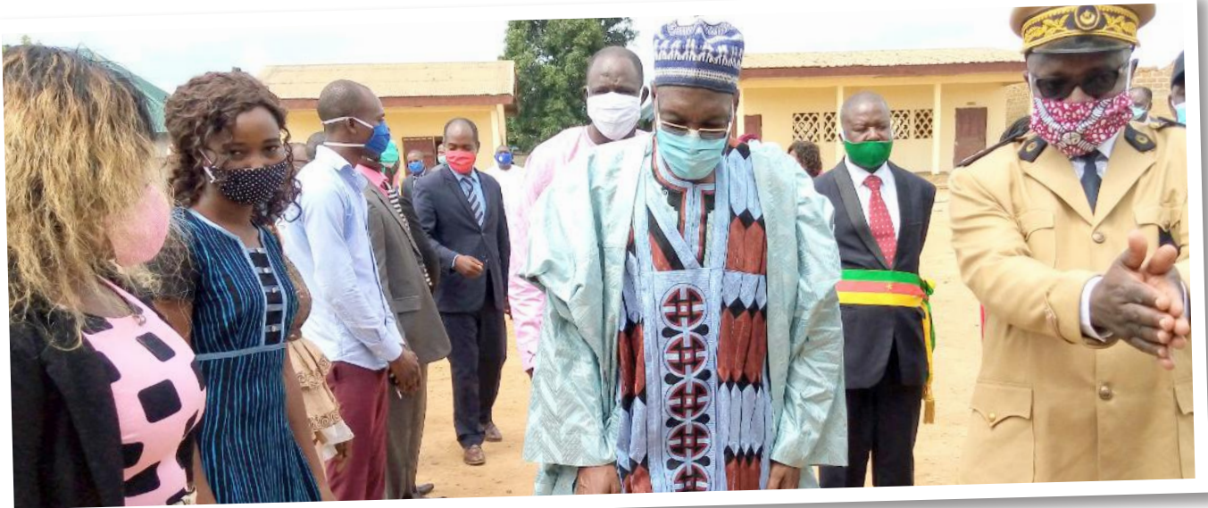
Accueil solennel du MINFOP