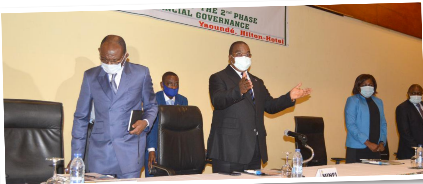
Début de la session du COPIL