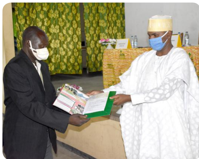
Cérémonie de remise de chèque dans le Nord

Aux vues de la crise sanitaire actuelle ajoutée aux aléas habituels de la vie agropastorale, ces chèques ne pouvaient que bien tomber. Pour maintenir et étendre leurs acquis, les producteurs par ces chèques continueront le développement efficace de leurs activités ainsi que leurs conditions de vie. Une mission du STADE C2D a pu apprécier la remise en présentiel des chèques d'un montant global de plus de 540 millions de FCFA dans la zone septentrionale du pays.