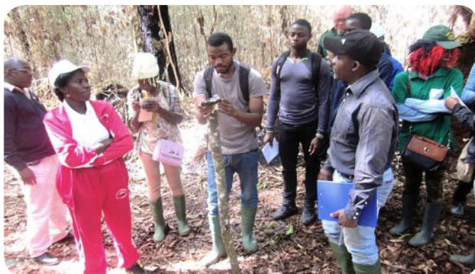
Sur le terrain, les études se poursuivent

Depuis 2014, 128 personnes ont été formées par l'unité de recherche en géomatique environnementale de l'université de Dschang. Cinq sessions de formation continue en cartographie, télédétection et système d'information géographique (SIG), en faveur de la communauté universitaire de Dschang (enseignants-chercheurs et étudiants) ont été organisées. Un atelier national de formation sur la numérisation de données géologiques, cartographie et estimation de réserves de minéraux du développement, dans le cadre du Programme ACP-UE, en faveur des minéraux de développement, s'est tenu. De même, six écoles de terrain ont été organisées avec la participation de 343 étudiants et 21 enseignants chercheurs.