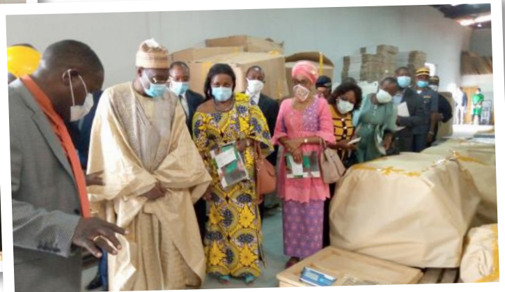
Présentation des acquisitions