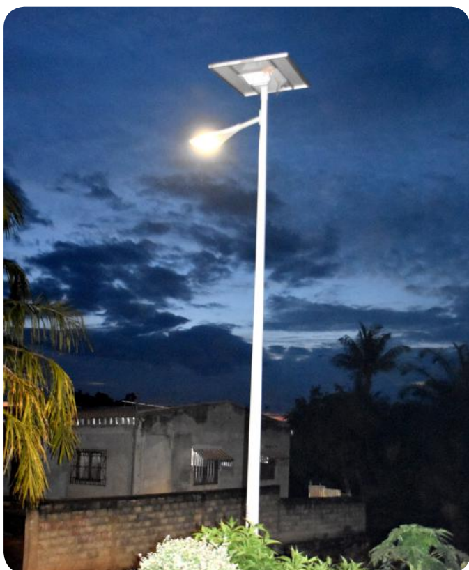
L'éclairage public opérationnel