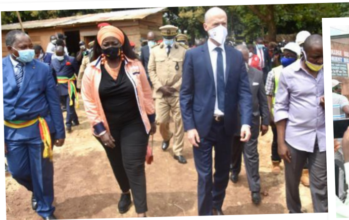
Le Maire de la ville en bon hôte