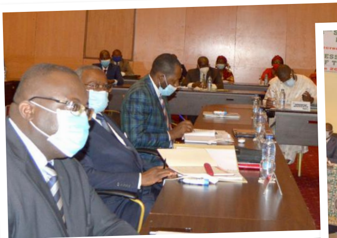
Vue des participants