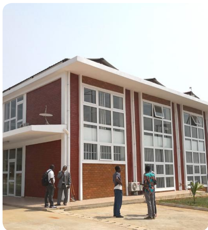
Les locaux de Capitales Régionales de Bertoua

Avec tous ces équipements et infrastructures, le C2D contribue, fortement, à transformer le chef-lieu de la région du Soleil levant, tout en facilitant la vie et le bien-être des populations.