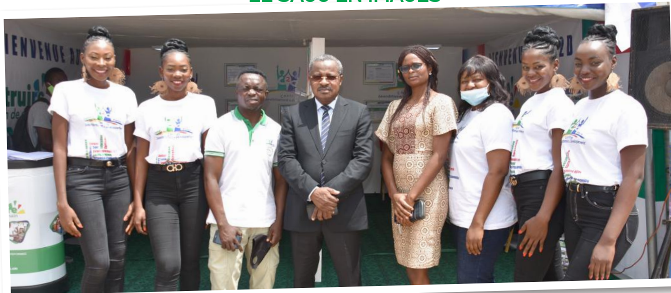
Le DG de la CAA, Président du CTB nous a rendu visite