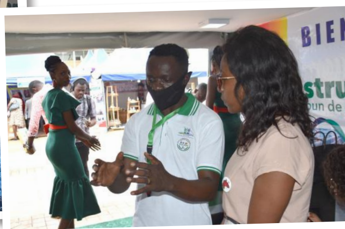
Des visiteurs à l'écoute