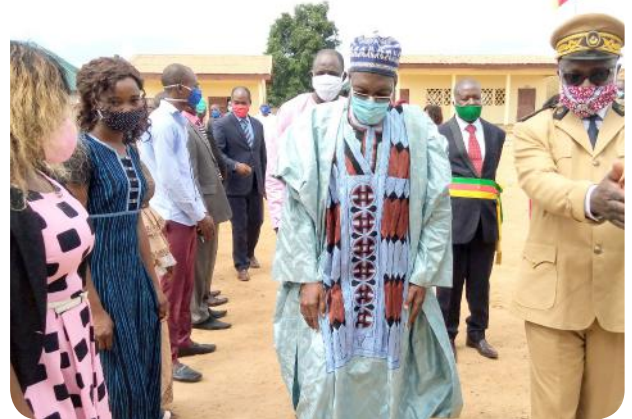
Accueil solennel du MINEFOP