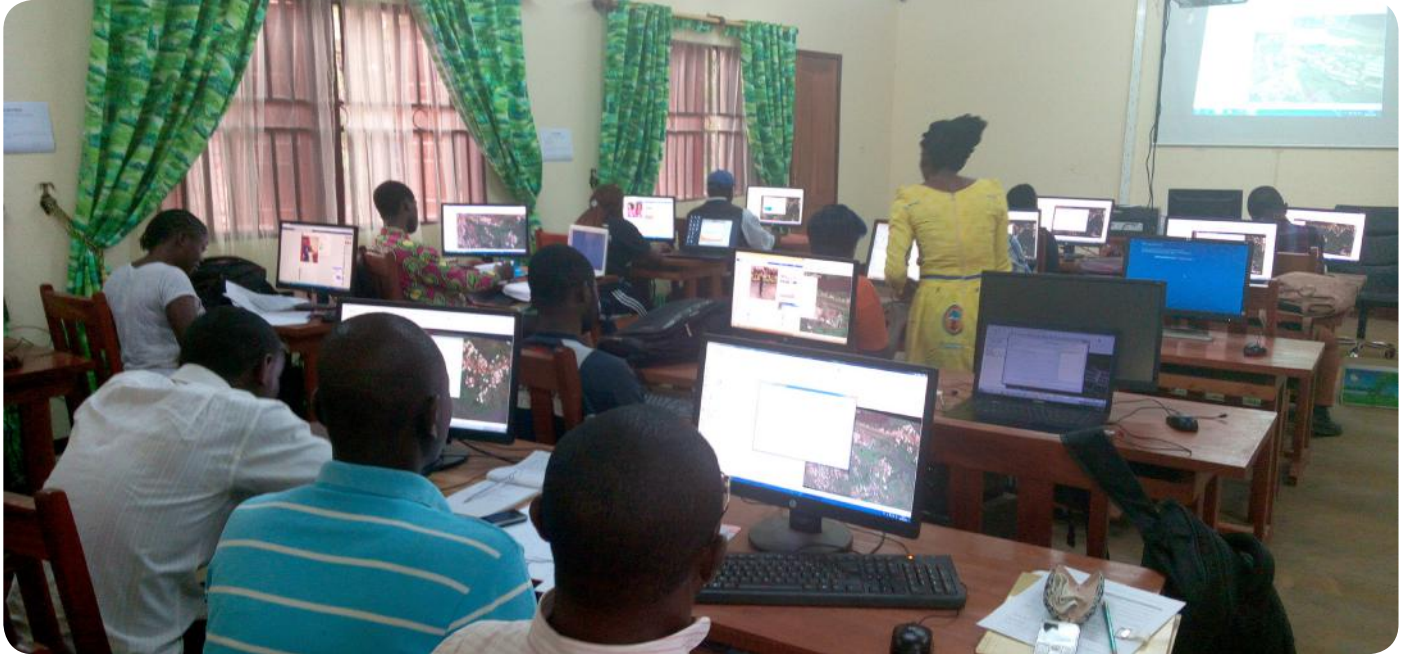
Un centre à la pointe des TIC

Financée par le C2D, la structure affiche un bilan positif et des résultats concrets. Son laboratoire est unique en Afrique centrale.