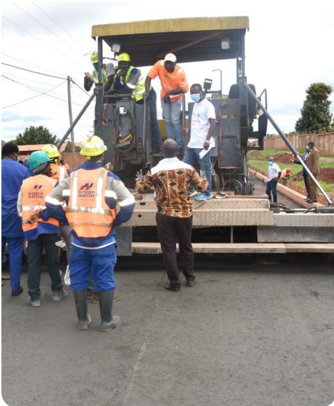
Bertoua aura de nouvelles routes