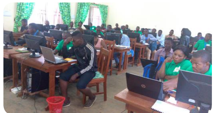
Les apprenants lors d'un cours

L'objectif principal de l'appui du C2D est de soutenir des projets de recherches, de formations et d'appui au développement (services à la communauté), portant sur les technologies de la géomatique appliquées à la gestion durable des forêts et des ressources naturelles. Dans ce cadre, et au-delà de l'appui financier pour le fonctionnement, la contribution du C2D a permis de doter le centre en infrastructures et équipements, notamment des GPS standard et pour système d'information géographique, des boussoles, des capteurs bi-fréquences, des dendromètres, des clisimètres, des