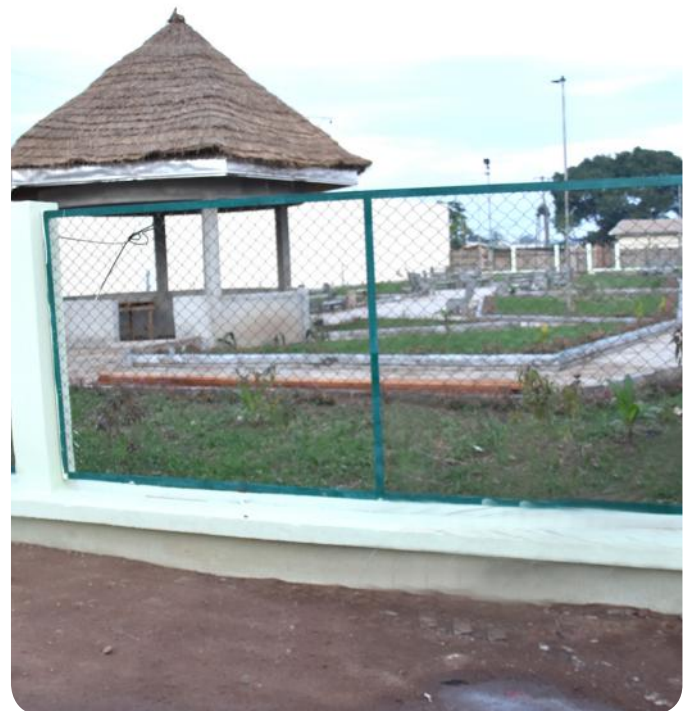
Le futur jardin public sort progressivement de terre

Le plus spacieux aura des allures de «Parcours vita» avec un terrain multisports, une salle de fêtes de 300 places ainsi qu'un restaurant de même capacité.