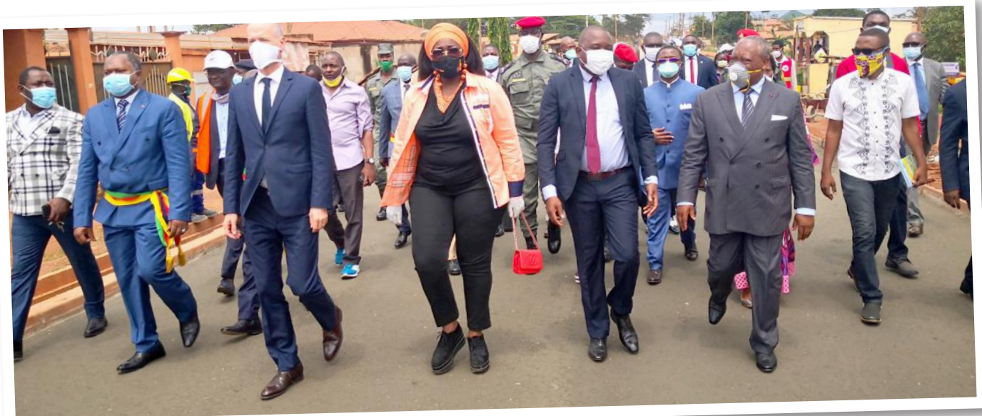
La route en béton compacté au rouleau ravie