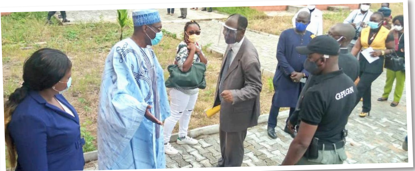
Le MINEFOP visite un chantier