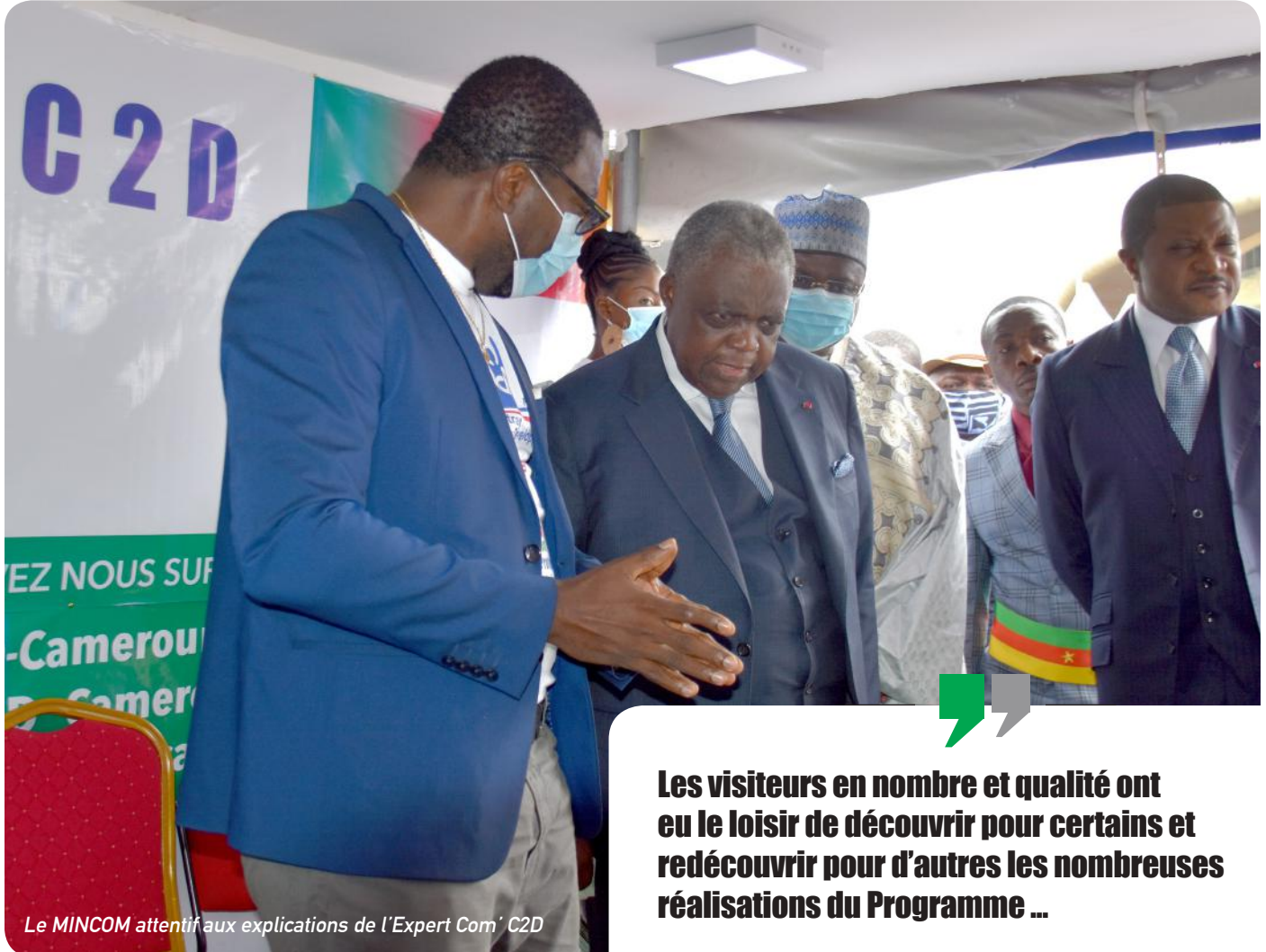
Le MINCOM attentif aux explications de l'Expert Com' C2D

Les visiteurs venus nombreux ont pu en savoir davantage sur le Programme et apprécier l'étendue des réalisations de cet outil franco-camerounais de coopération.