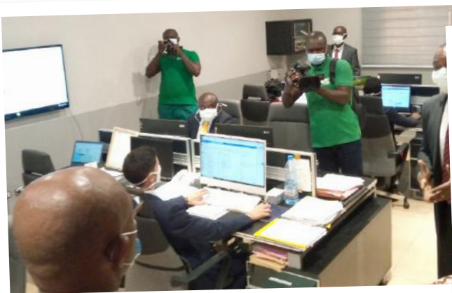
Les TIC mis en avant