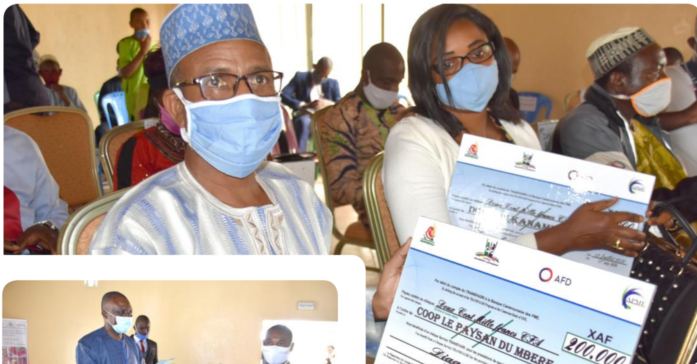
Des chèques pour une meilleure santé des entreprises

Les PME bénéficiaires des régions de l'Adamaoua et du Nord ont reçu des chèques services, et les entreprises prestataires leurs accréditations.