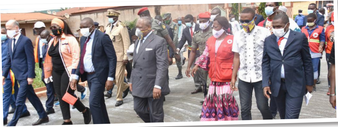
La délégation sur le terrain