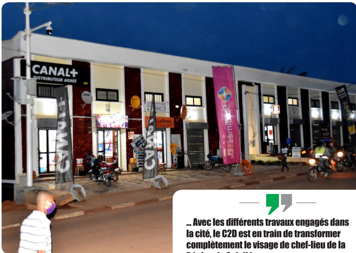
Les boutiques construites par le C2D

Progressivement le visage de la Capitale Régionale de l'Est change grâce au financement C2D.