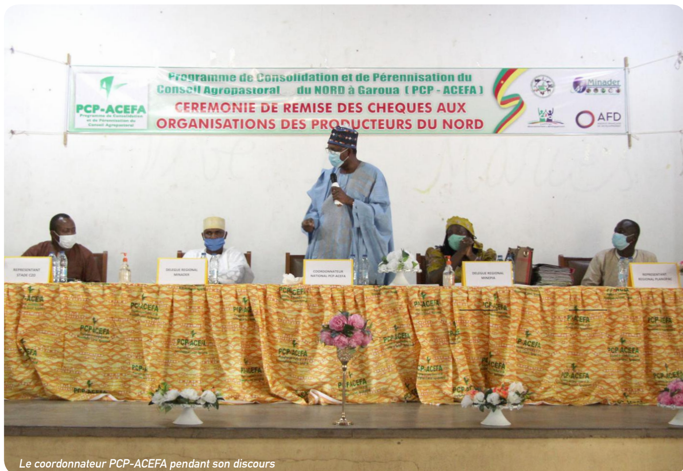
Le coordonnateur PCP-ACEFA pendant son discours

Les groupements de producteurs de 9 régions du pays ont reçu près d'un 1.5 milliard d'appuis financiers au courant des mois de juillet et août 2020 par le programme C2D ACEFA.