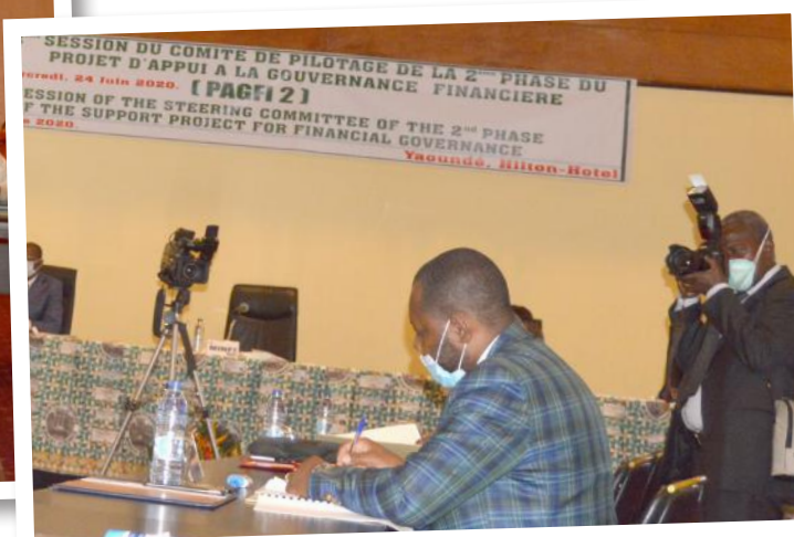
On prend des notes