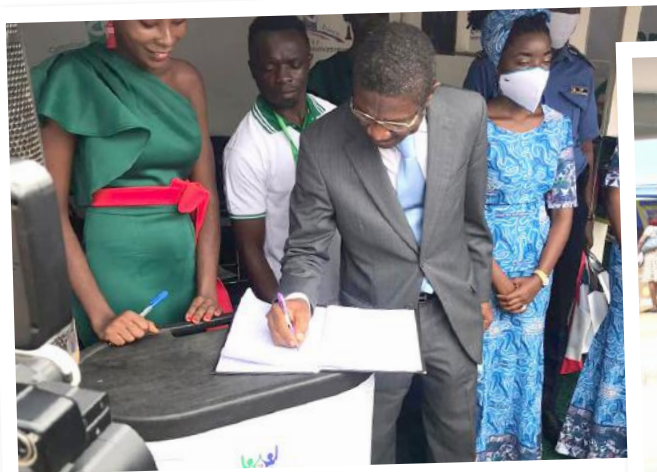
Le Maire de la ville signe le livre d'or