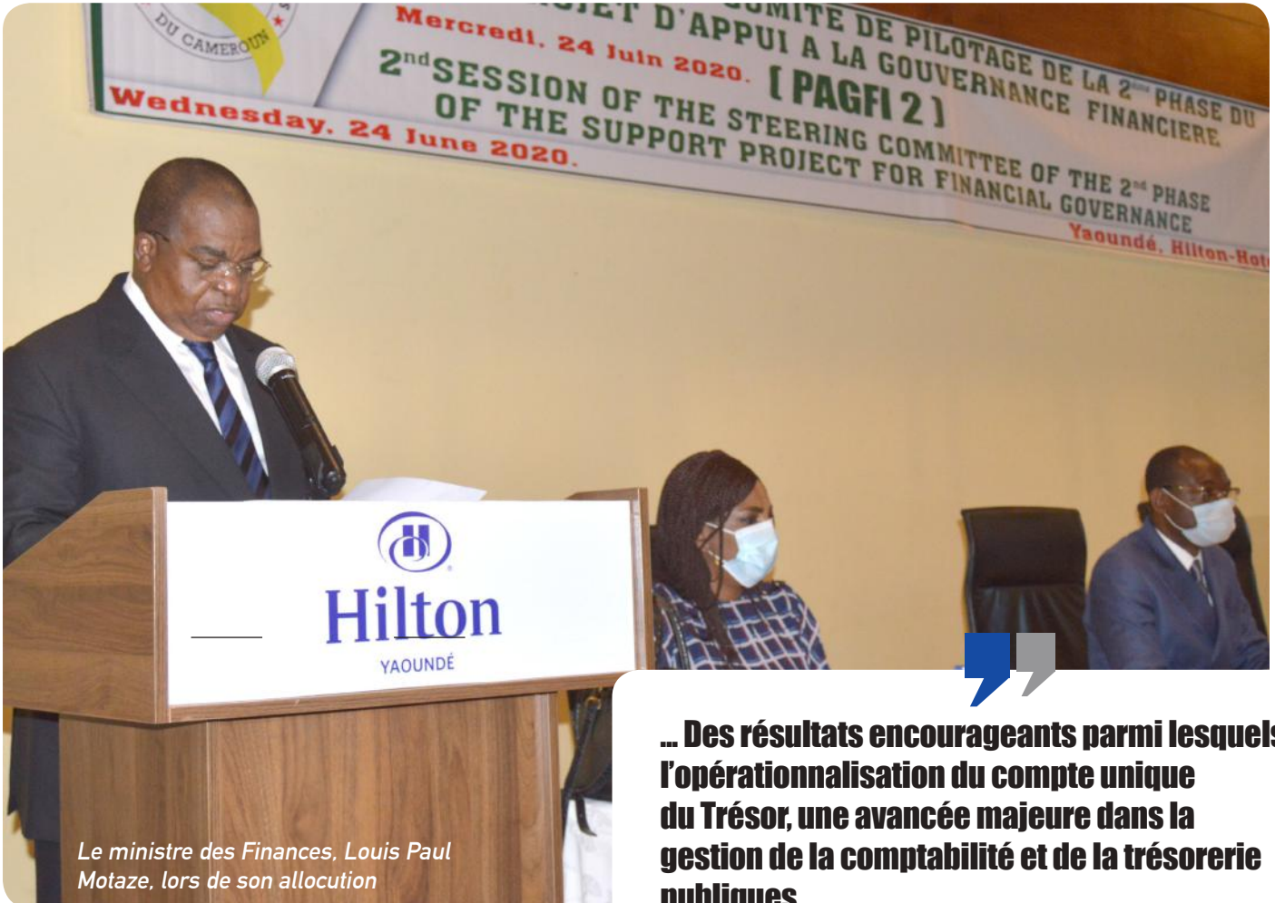
Le ministre des Finances, Louis Paul Motaze, lors de son allocution

Le ministre des Finances, Louis Paul Motaze, a réitéré l'importance de ce projet lors de la 2 ème session du Comité de pilotage tenu le 24 juin 2020 à Yaoundé.