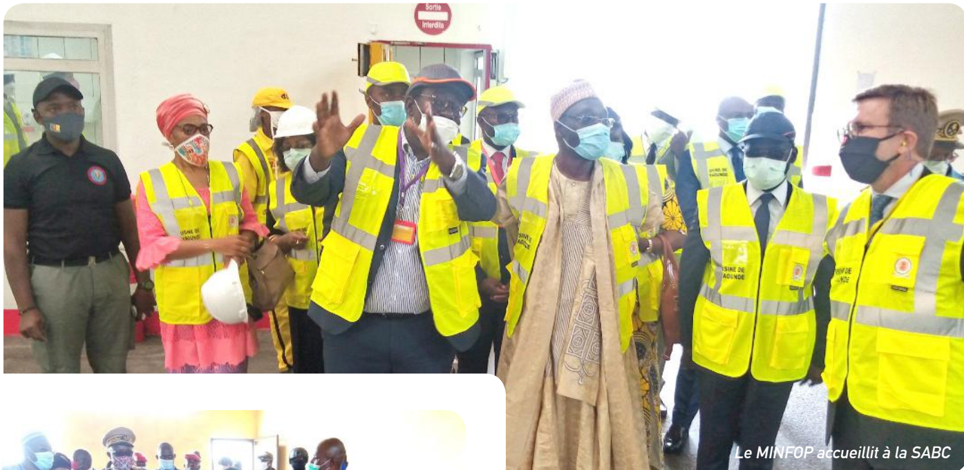
Le MINEFOP accueilli à la SABC

Issa Tchiroma est descendu sur le terrain pour apprécier les niveaux d'évolution de la mise en place des projets financés par le C2D.