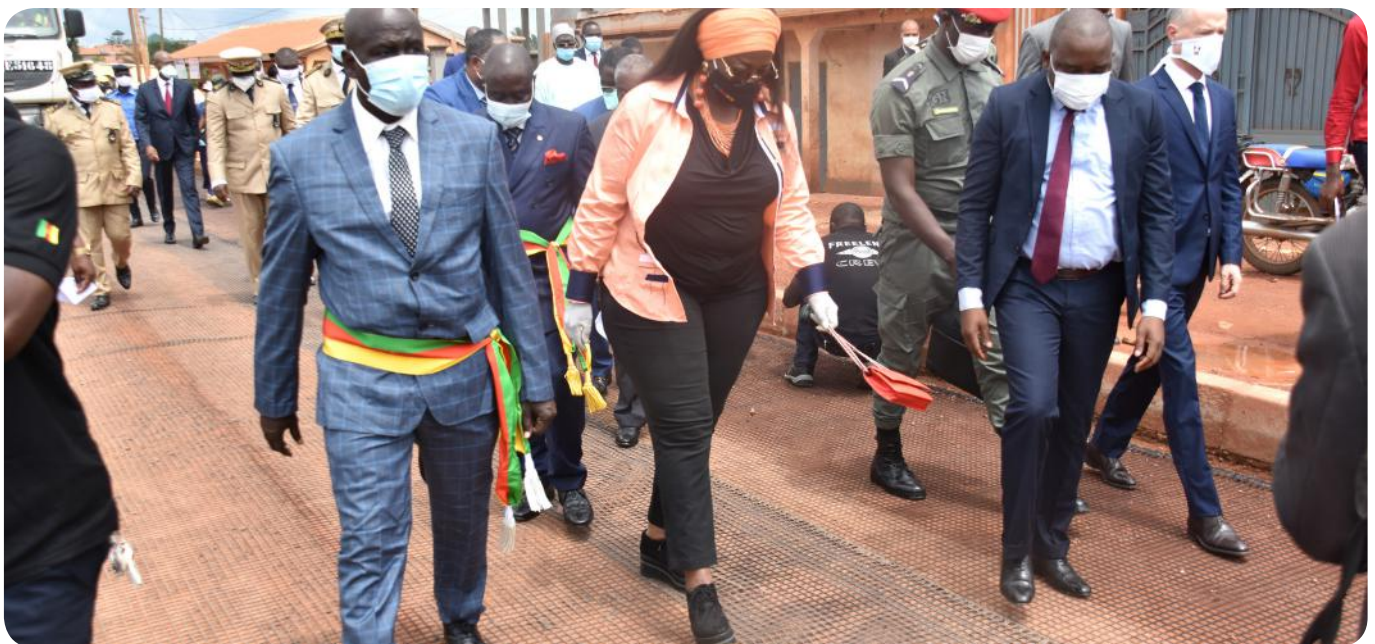
Sur les traces de Capitales Régionales à Bertoua

Le 16 juillet 2020, la ministre de l'Habitat et du Développement urbain (MINDHU) a effectué, en compagnie de l'ambassadeur de France au Cameroun, une visite de travail sur les chantiers du C2D-Capitales régionales à Bertoua. La veille, le ministre de l'Emploi et de la Formation professionnelle (MINEFOP) engageait, dans la région du Centre, une tournée d'une semaine qui allait le conduire dans trois autres régions, sur les chantiers du Projet C2D-Formation professionnelle.