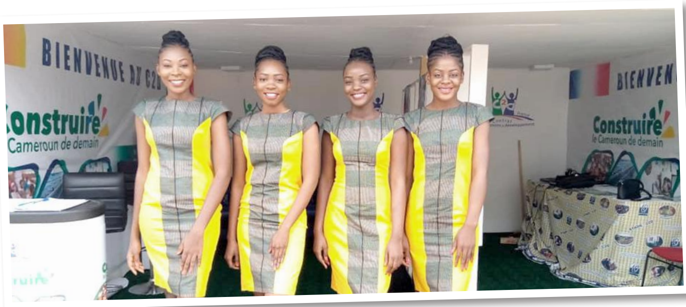
Nos hôtessees chaleureuses et souriantes