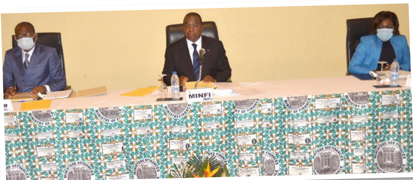
Le MINFI entouré de ses collaborateurs