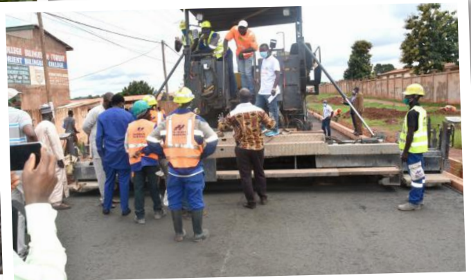
Bertoua, les travaux se poursuivent