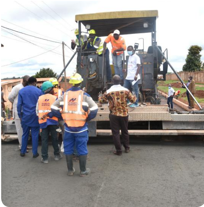
Bertoua, les travaux se poursuivent