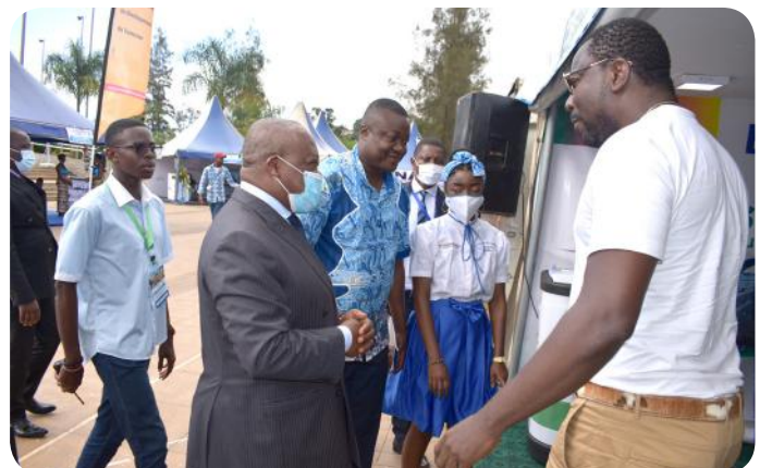
Le STADE-C2D a accueilli le MINFOPRA

Maire de la ville de Yaoundé, le Directeur Général de la Caisse Autonome d'Amortissement, Président du Comité Technique Bilatéral du C2D... qui n'ont pas manqué d'exprimer leurs satisfactions et encouragements.