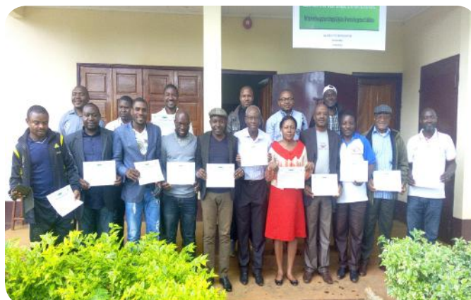
Remise de parchemin à une promotion

Au regard du chemin parcouru et du bilan, l'espoir de voir cette pérennisation effective est permis.