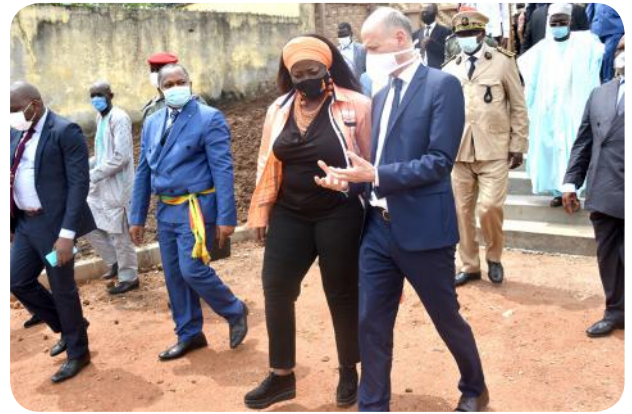
Echange entre le MINDHU et l'Ambassadeur de France