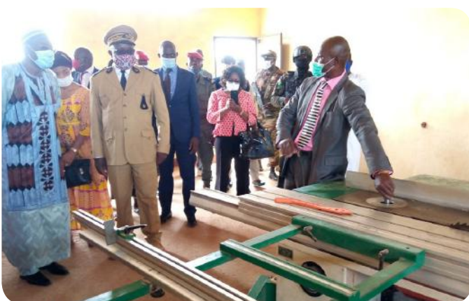
Présentation du savoir-faire des CFM

D u 15 au 24 juillet 2020, en voiture ou en train, le ministre de l'Emploi et de la Formation professionnelle (MINEFOP), Issa Tchiroma Bakary et sa suite se sont rendus dans les régions du Centre, de l'Est et de l'Adamaoua. Cette tournée avait pour objectifs spécifiques la visite de quelques structures de formation professionnelle du domaine de la transformation des produits agricoles. Il s'agissait également de sensibiliser les acteurs du domaine de la maintenance industrielle et du transport logistique sur l'architecture de l'offre de formation des Centres de formation professionnelle sectoriels (CFPS), autour des Centres de formation aux métiers (CFM).