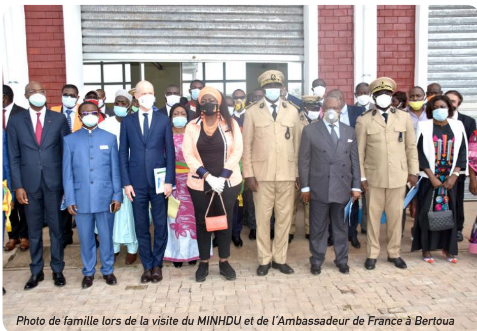
Photo de famille lors de la visite du MINH DU et de l'Ambassadeur de France à Bertoua

Au cours de cette journée marathon, la délégation a visité les ouvrages réalisés ou en cours, dans le cadre des principales composantes du programme. «Le programme C2D-Capitales régionales, dans la ville de Bertoua, a atteint sa vitesse de